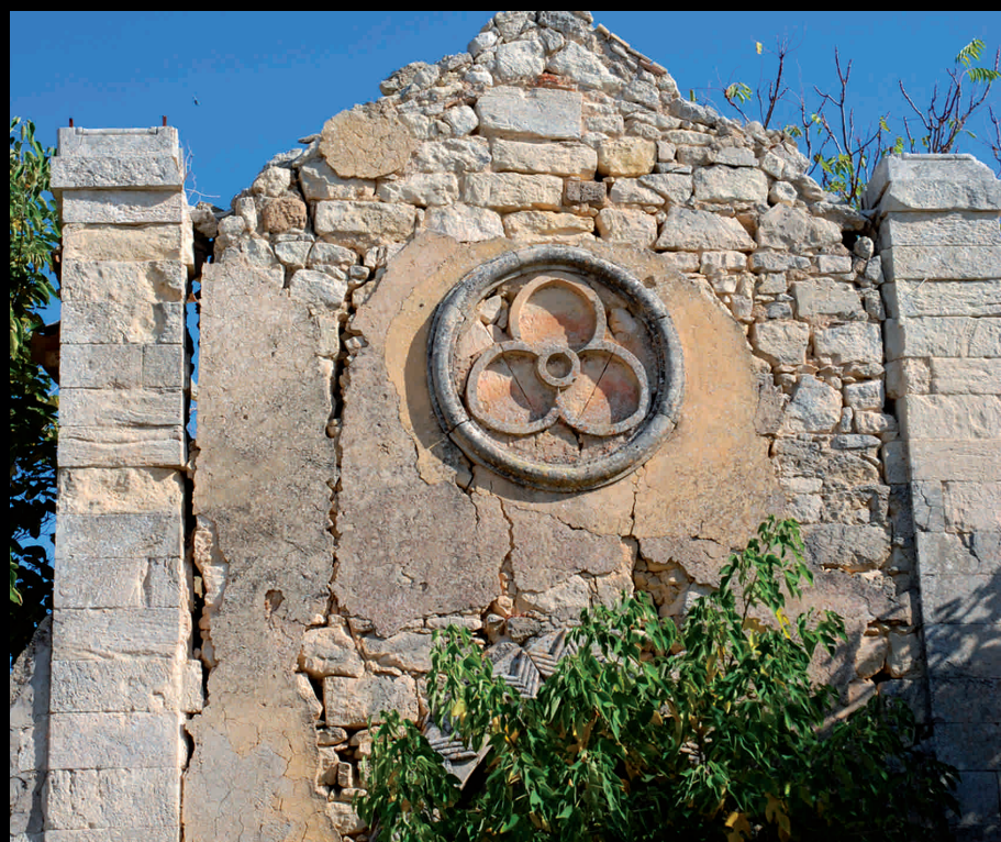
Rampinzeri, chiesetta del Castello - Rampinzeri, iglesuela del Castillo