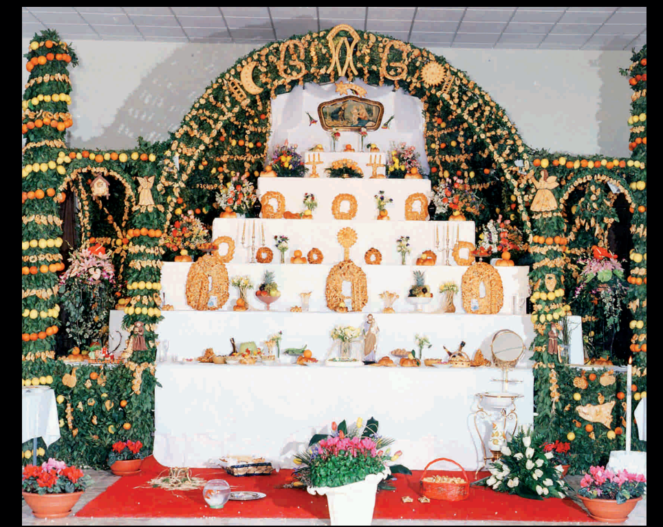
Altare di San Giuseppe - Altar de San José

Extra circuito-Circuito esterno: Castello Rampinzeri Castello Rampinzeri Antico baglio seicentesco, ha ora l'aspetto di un castellotto neogotico Castillo Rampinzeri Antiguo bao del s. XVII, tiene actualmente el aspecto de un pequeño Castillo neogótico