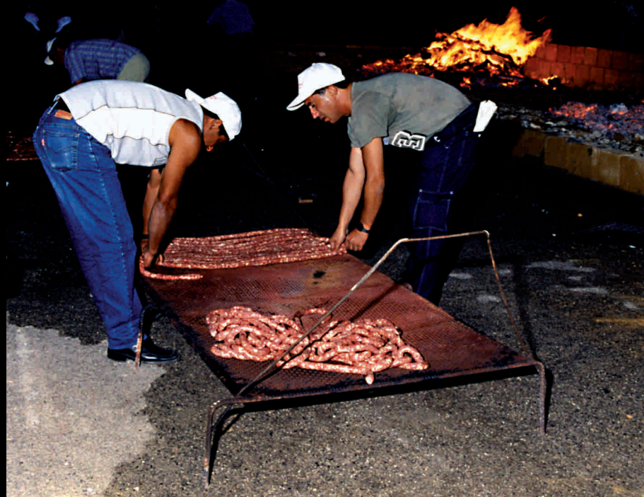
Sagra della salsiccia - Feria de la salchicha