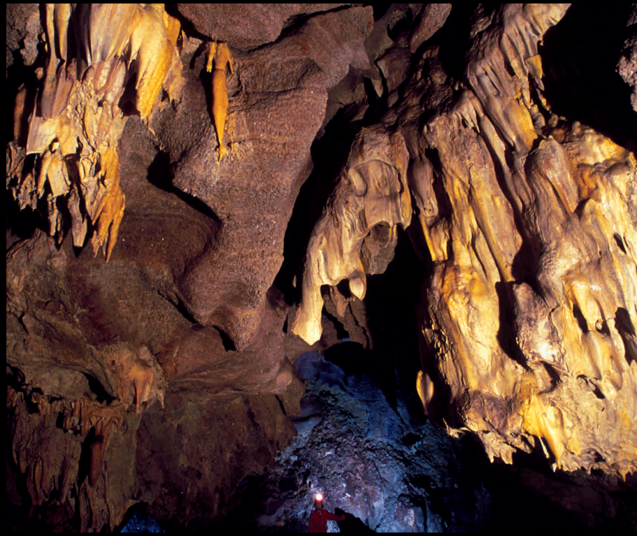
Grotta di Santa Ninfa - Gruta de Santa Ninfa