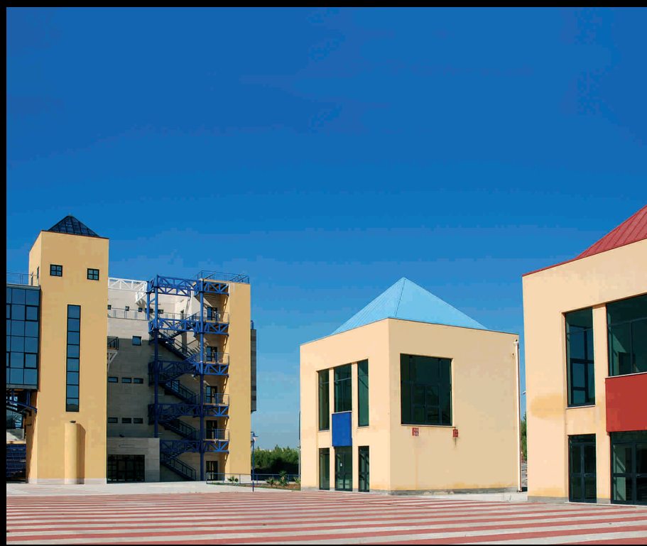
Centro artigianale - Centro artesanal